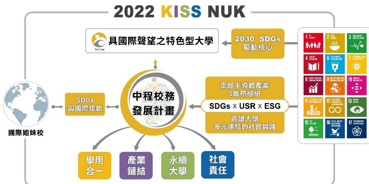
圖 1 112-115 年國立高雄大學校務發展綱要

校內並以 SDGs（Sustainable Development Goals，簡稱 SDGs）在地詮釋為行動指引，持續精進關鍵目標的實現和體制的完善，對外連結在地產官學策略聯盟與國際夥伴（東南亞大學），共同詮釋 SDGs 與 ESG 理念（圖 1）。 1 我們將 SDGs 內化至高雄大學，配合行政院「數位國家·創新經濟發展方案」、五加二產業創新、「展綠、增氣、減煤、非核」能源轉型及臺灣 2050 淨零排放策略等政策願景，培育國家發展所需之特色領域與前瞻技術人才，藉由「SDGs-Inside」接軌國際，擬定學用合一與跨域教學、特色研究與產業鏈結、永續大學與素養深化及大學社會責任與全人教育等四大校務發展目標，致力於達到「結合教學研究與產業發展，重視人文素養與科技創新，培育精英人才之特色優質大學」之學校定位。