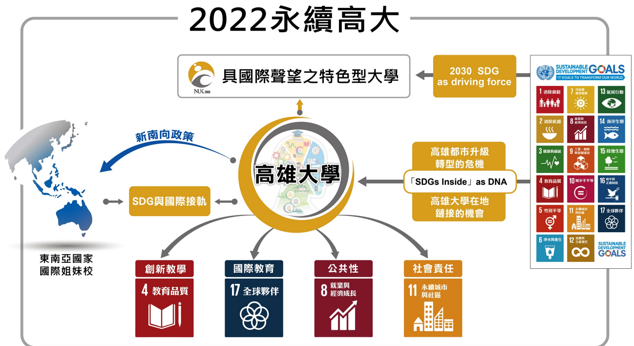
【圖 1】國立高雄大學以融入「SDGs-Inside」為導向之校務中程計畫之架構

有鑒於此，本校在「教與學」面向上，努力建置網路化、行動化之自主、多元、彈性學習環境，結合科技潮流，朝向個人化及行動化之人才培育發展，並提升弱勢學生向上翻轉之能力；在「研究與產學」面向，強化與在地學術之策略聯盟及深化與在地產業之人才培育與研發基地之橋接，整合資源提升大學對在地區域或社會之貢獻；在「國際化」面向上，藉由 EMBA 在越南、泰國之境外教學、東亞語文學系之境外交流及東南亞發展研究中心之成立，透過 SDG 項目之合作，深化並鏈結現有國際合作之基礎。期許在產學合作、國際交流及教與學環境特色建立之後，再朝向培育「全球在地化」、「在地全球化」（Glocalization）之優質人才邁進。