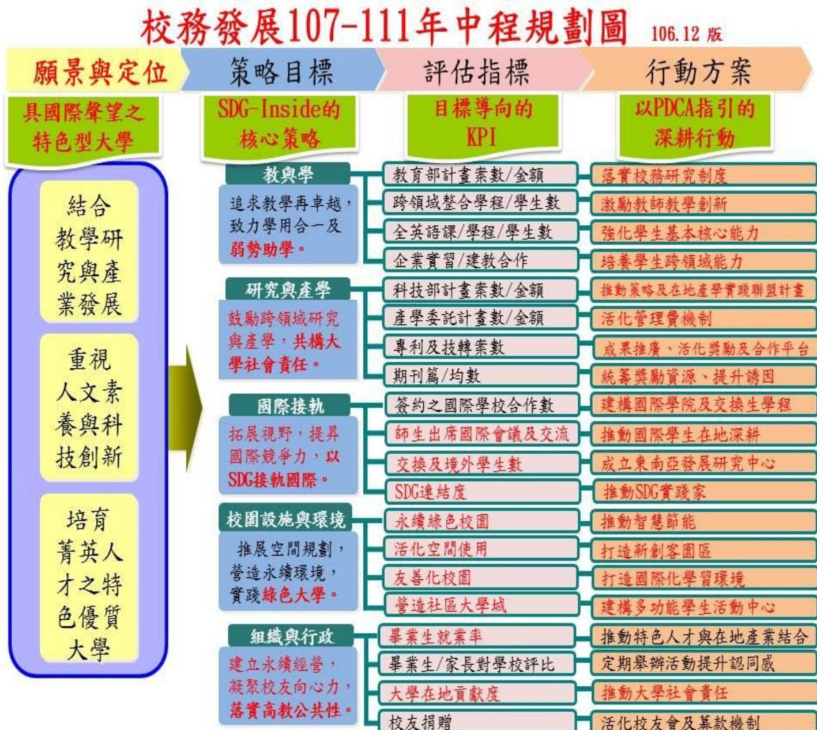
【圖 2】國立高雄大學校務發展 107-111 年中程規劃圖

在全校師生同仁努力下，102 至 106 年度辦學績效已逐步彰顯。然為因應全球高等教育國際化之趨勢、少子化與高齡化之影響、新南向政策、「數位國家、創新經濟」科技政策、教育部高教深耕、創新轉型、大學社會責任等計畫、高雄市產業發展方案等，以及本校 104 至 106 年度教學卓越計畫之執行成果，因此，在 107 至 111 年度之校務發展重點，將以「校務發展 107-111 年中程規劃圖」為基礎，導入「SDGs-Inside」做為未來五年校務發展之策略指引，並基於上述環境變化及執行成效考量，重新檢討，擬定最新具體可行之行動方案及重點工作，並廣續進行管考。